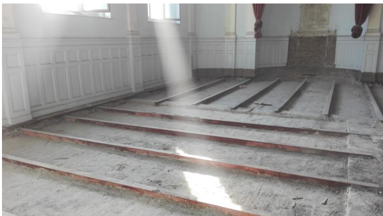
Templom földem megerősítés előtt