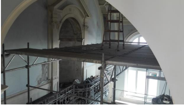
A galéria szintnél is magasabb állványzat