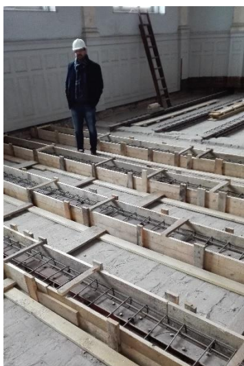
Teherbírási növelő „öszvér” szerkezet betonozás előtt