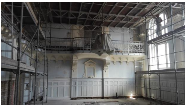
A földem már elkészült