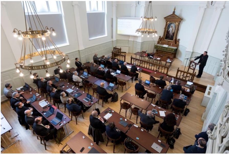
Zsinati ülés felújítás után